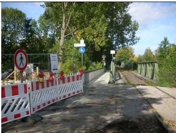
Vom Stadion nach links gehen und dann über diese Brücke der Augsburg Localbahn