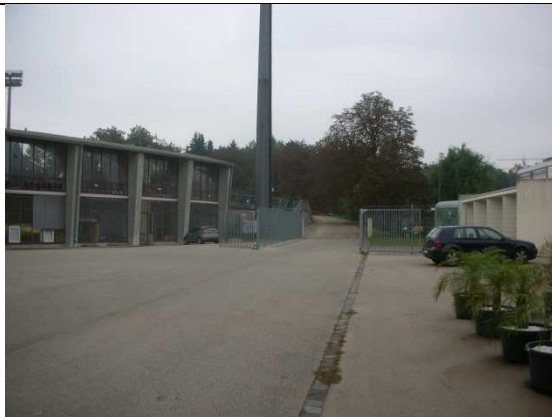
Auffahrt zum Boxer-Camp