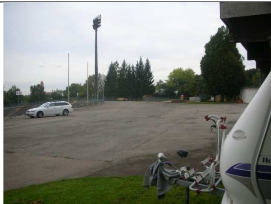
Hier wohnen Sie