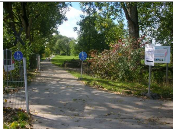
Dieser Fussweg führt in wenigen Minuten zum Stadion