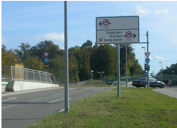
Links zum Boxer-Camp, rechts zum DM Stadion