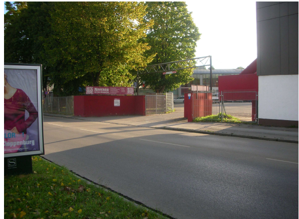
Einfahrt zum Boxer-Camp Keine Parkmöglichkeit zur Auslosung und zum Festabend.